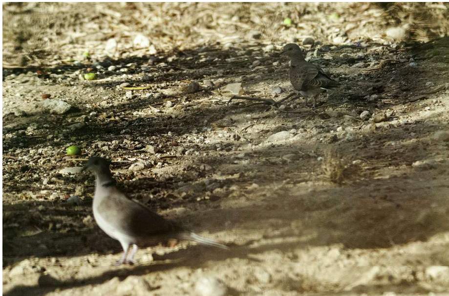
Fig. 2 — Una immagine della Tortora dal collare e della Tortora selvatica fotografate nel pollaio.