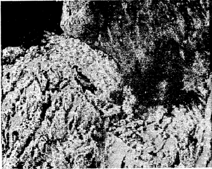
Fig. 1. - Grifone adulto posato sulle rocce nei pressi del nido.

<< attraversano, a breve distanza le une dalle altre, foreste, paludi << boschi dalle più interessanti essenze, con un lago perenne a 1200 << metri di altitudine, la varietà di piante, anche coltivate, tra le << quali il carrubbo e l'interessantissimo pistacchio; se si pensa