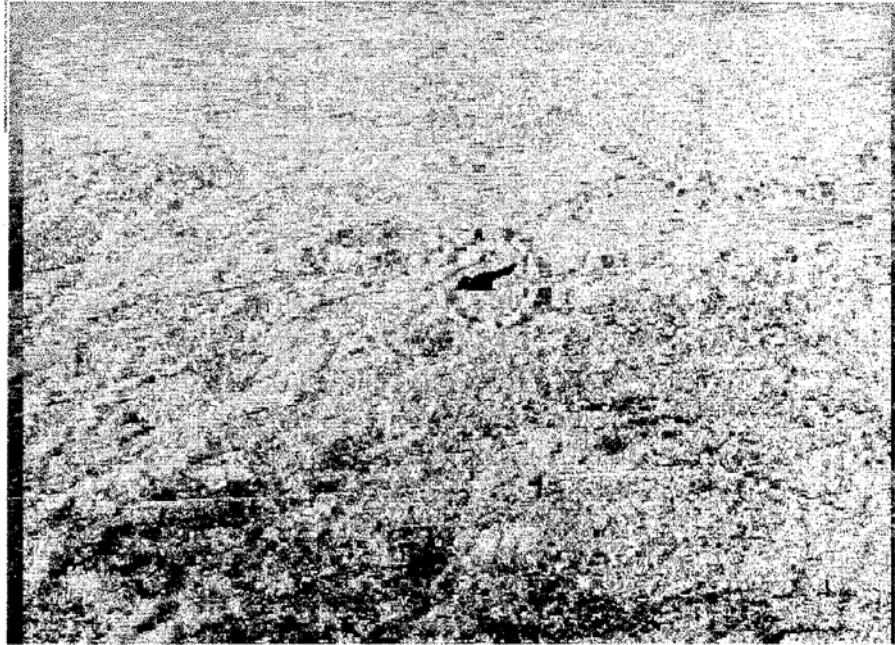
Fig. 2. – Grifone in volo su una vallata delle Caronie.

Negli ultimi due anni i monti di Alcara vennero preclusi allo esercizio venatorio; tale divieto però non aveva per scopo l'auspicata protezione del Grifone, bensì l'incremento della selvaggina