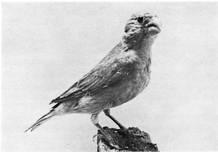
Fig. 2. — Trombettiere catturato presso Catania nella primavera 1971.

Zigolo capinero - Emberiza melanocephala , SCOPOLI.