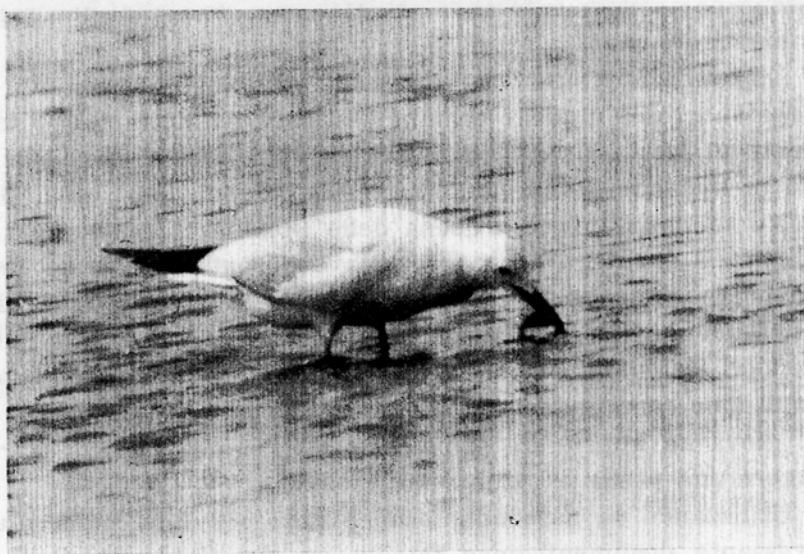
Fig. 2. — Gabbiano roseo nell'atto di catturare una preda.

Ben diverso è il comportamento del Gabbiano roseo. Selezionando la letteratura specializzata a mia disposizione trovo solo poche notizie specifiche sull'argomento. DEMENT'EV ed altri (1951, traduzione in inglese dal russo del 1969) scrivono che le abitudini